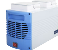
Chemker 610 最大真空度: 7 mbar 最大流量: 34 (30) L/min