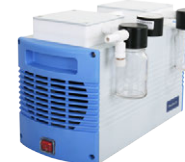
Chemker 611 最大真空度: 7 mbar 最大流量: 34 (30) L/min