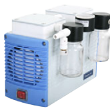
Chemker 411 最大真空度: 10 mbar 最大流量: 20 (18) L/min