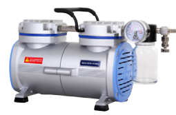
Rocker 410C 最大真空度: 25 mbar 最大流量: 23 (20) L/min