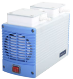
Chemker 410 最大真空度: 10 mbar 最大流量: 20 (18) L/min