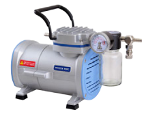
Rocker 300C 最大真空度: 145 mbar 最大流量: 23 (20) L/min