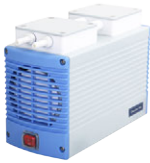
Chemker 400 最大真空度: 105 mbar 最大流量: 38 (33) L/min