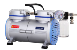
Rocker 400C 最大真空度: 105 mbar 最大流量: 34 (31) L/min